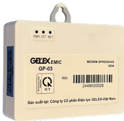
Modem GPRS/3G/4G, kiểu GP-03